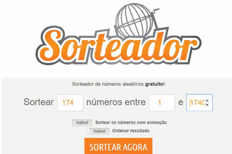
Imagem 4 - Plataforma Sorteador.com.br

Para aumentar a credibilidade da amostra retirada dos comentários de A Espera , foi utilizada a plataforma Sorteador.com.br , que possibilita a escolha de qualquer quantidade de números, entre qualquer outra quantidade de números, de forma 100% aleatória. Os 174 comentários selecionados foram escolhidos como mostra a Imagem 4: