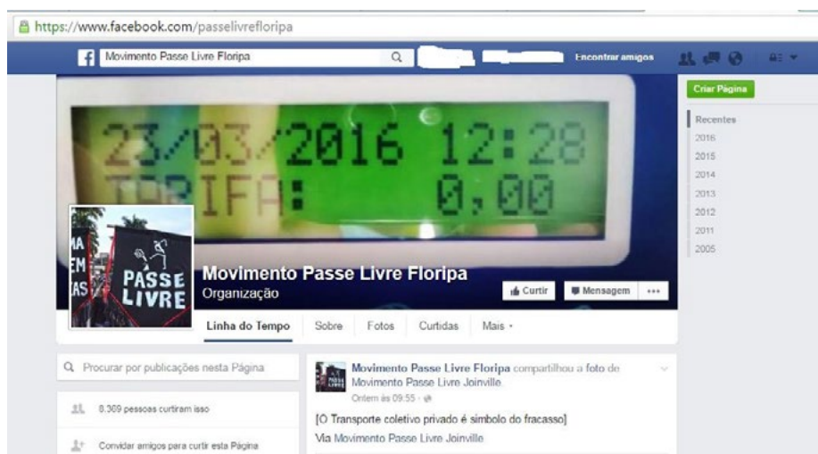
Figura 2 - Página “Movimento Passe Livre Floripa”

A plataforma digital Facebook é percebida no ciberespaço da rede Internet através de suas múltiplas páginas pessoais, comerciais ou institucionais. As páginas são expressas como interfaces gráficas que, a despeito das postagens características de cada entidade, também mantém, como moldura, uma identidade gráfico-visual que é comum a todas as páginas (Fig. 2). Isso propõe unidade ao amplo e diversificado conjunto de páginas que compõe o website Facebook .